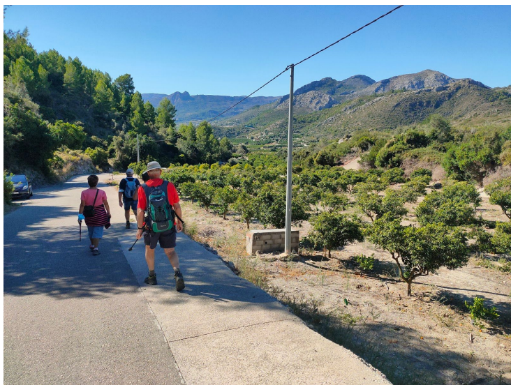
Vandringen ner till Benimeli på asfalterad väg mellan apesinträd.