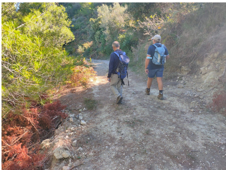
Den plana delen av vandringen