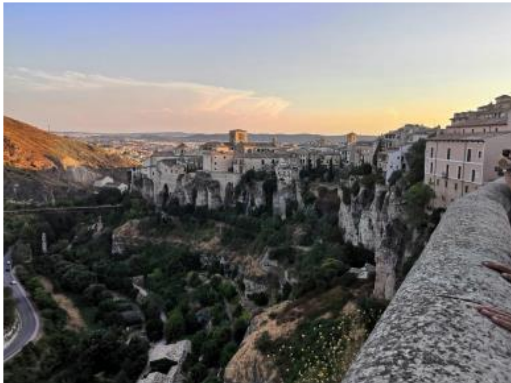
La Ciudad Encantada