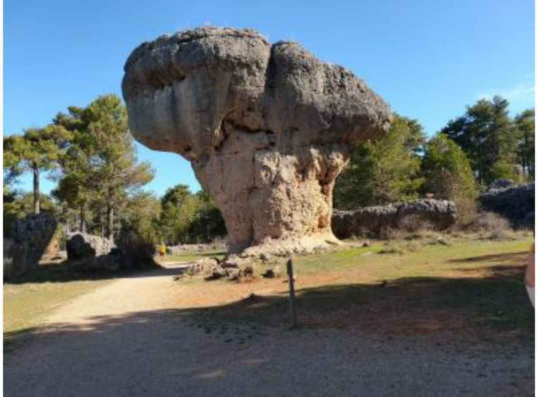
Nacimiento del Rio Cuervo