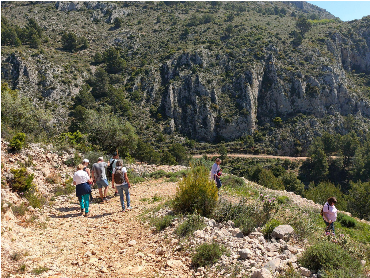
På väg tillbaka